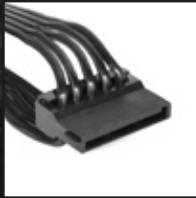
4x SATA kable od zasilania