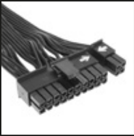
1x 20+4 pin kabel do płyty głównej