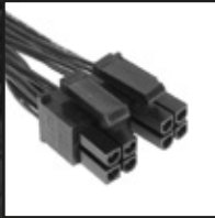
1x 4+4 pin kabel od CPU