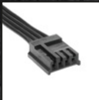
1x Floppy kabel