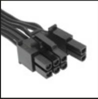
2x 6+2 pin PCIe kable