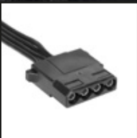
2x 4 pin kable Molex